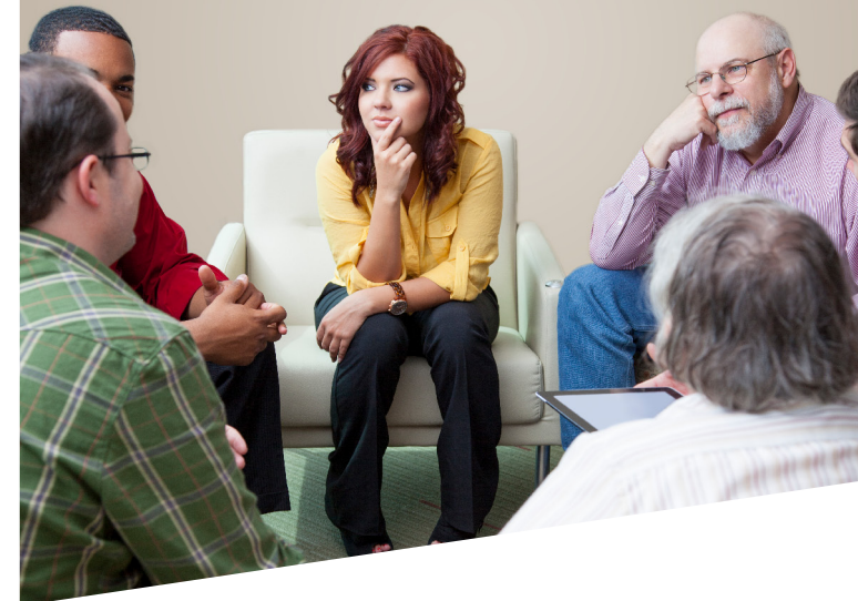
Fédération Française des Diabétiques - Paris - 01 40 09 25 25 contact@federationdesdiabetiques.org - Conception : Krolline France 01 42 59 37 97 - novembre 2017